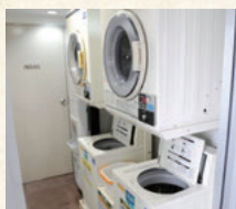
ランドリーコーナー