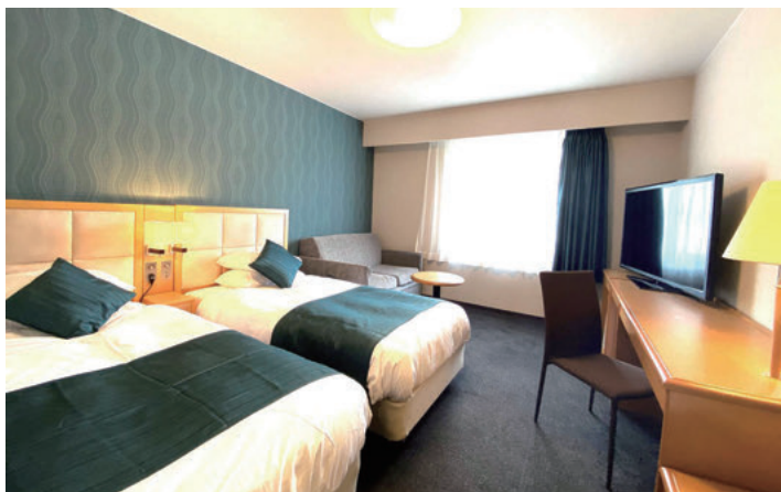
レギュラーツイン <20m 2 > 1名～3名様用 / ベッド幅 97 cm