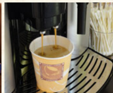
コーヒーサービス