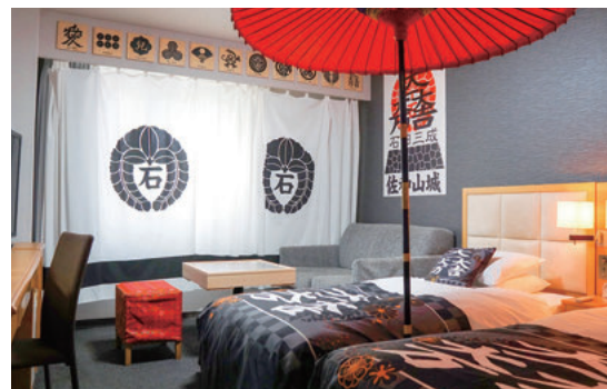
三成ルーム (ツイン)