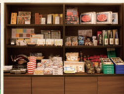
お土産コーナー (24時間営業)