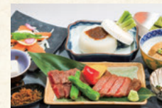
夕食 会席料理やコース料理など (要事前予約)