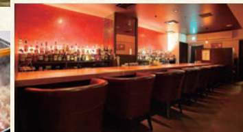
BAR「Salon Bar Thistle (サロンバー シスル)」