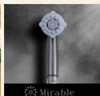
全室ミラブル完備