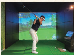
シミュレーションゴルフ場