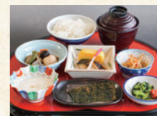
朝食 和定食・パンやサラダなどのハーフバイキング