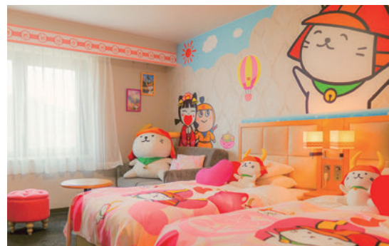
ひこにゃんルーム (ツイン) *2パターン