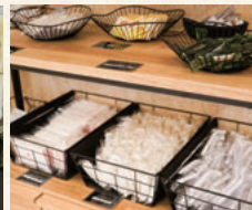
ロビーのアメニティコーナー